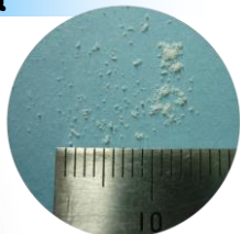
サラサラなパウダー状