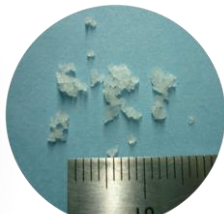
しっとりしたフレーク状