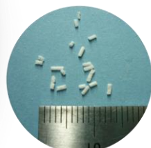
使いやすい顆粒状