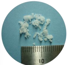
しっとりしたフレーク状