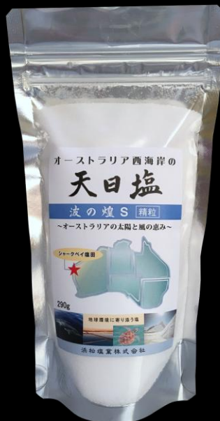
波の焔 S精粒 290g