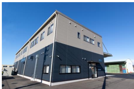
新社屋 (南東の角より)