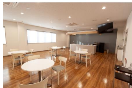
キッチンスタジオ フロント