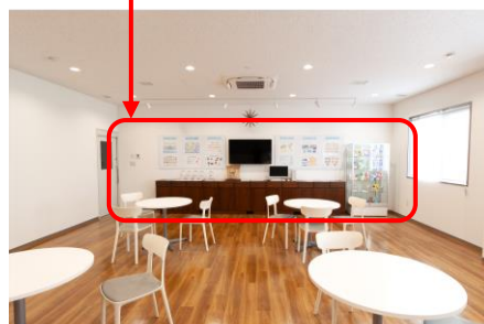
キッチンスタジオ リア